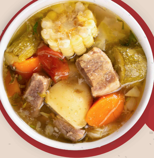
Caldo De Res $179 Con porción de arroz.