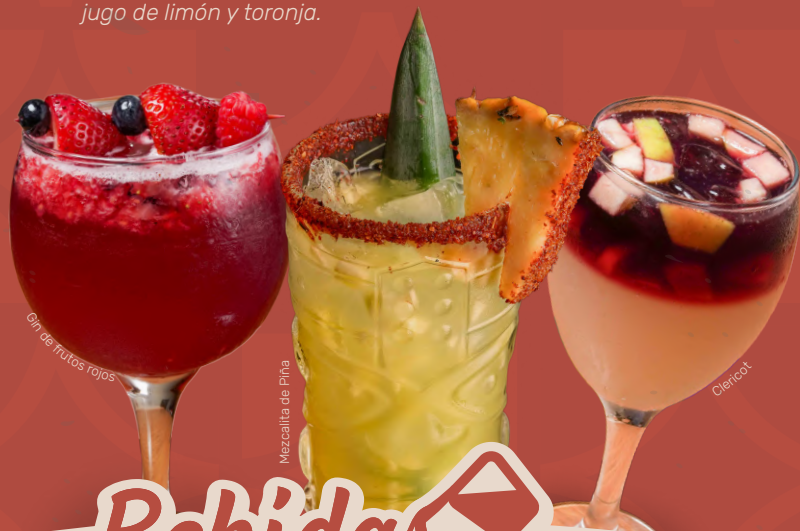
Gin de Frutos Rojos

Hierbabuena, ron, azúcar moscabada, jugo de limón y toronja.